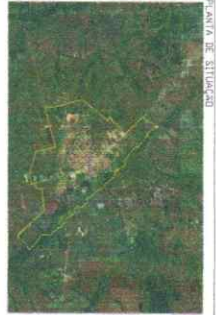
Figura 1 Área de estudo

INSTITUTO BRASILEIRO DE GEOGRAFIA E ESTATÍSTICA INSTITUTO DE AEROFOTOGRAFIA E CARTOGRAFIA INSTITUTO DE GEODÉSIA E GEOPHÍSICA INSTITUTO DE GEOPHÍSICA E GEODÉSIA INSTITUTO DE GEOPHÍSICA E GEODÉSIA INSTITUTO DE GEOPHÍSICA E GEODÉSIA