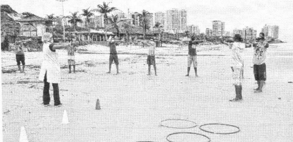
Além de testes voltados para a saúde, foram realizadas atividades físicas com pacientes do Caps AD