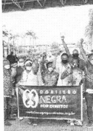
Coalizão Negra por Direitos