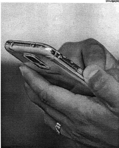
Celular pirata no Maranhão está recebendo mensagem de bloqueio

Os celulares considerados piratas são aqueles não certificados pela Anatel ou então que tenham o chamado IMEI (International Mobile Equipment Identifier) - que é o número de identificação do aparelho - adulterado, clonado ou que tenha passado por outras formas de fraude. IMEI é a identidade do aparelho.