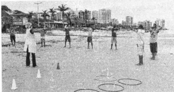
Além de testes voltados para a saúde, foram realizadas atividades físicas com pacientes do Caps AD