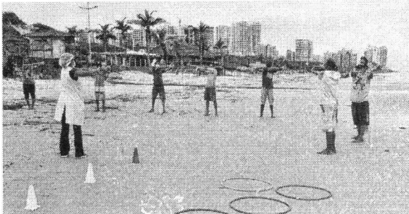
Além de testes voltados para a saúde, foram realizadas atividades físicas com pacientes do Caps AD

Ao longo da ação, 39 pacientes atendidos pelo Caps AD engajaram-se em atividades físicas na areia, com a supervisão de um educador físico. De acordo com Marcelo Costa, a ati-