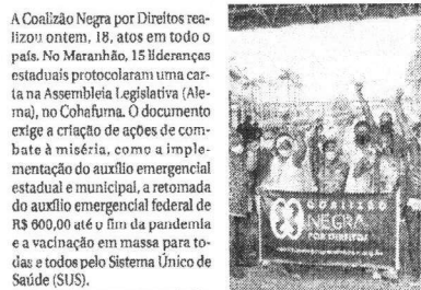
Coalizão Negra por Direitos

Lideranças do movimento negro no estado protocolaram documento na Alerma, ontem