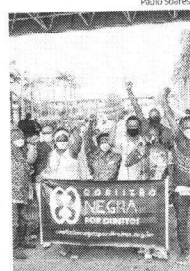
Coalizão Negra por Direitos

"Hoje, em todo o Brasil, está sendo protocolado esse documento