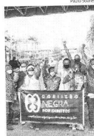
Coalizão Negra por Direitos

"Hoje, em todo o Brasil, está sendo protocolado esse documento