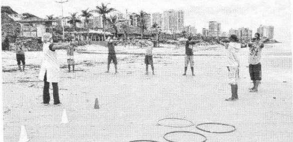
Além de testes voltados para a saúde, foram realizadas atividades físicas com pacientes do Caps AD

Ao longo da ação, 39 pacientes atendidos pelo Caps AD engajaram-se em atividades físicas na praia, com a supervisão de um educador físico. De acordo com Marcelo Costa, a ati-