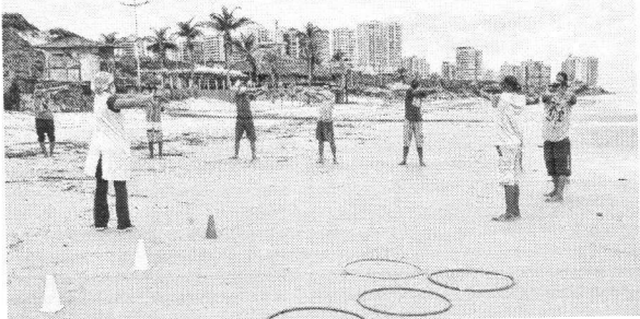
Além de testes voltados para a saúde, foram realizadas atividades físicas com pacientes do Caps AD

Ao longo da ação, 39 pacientes atendidos pelo Caps AD engajaram-se em atividades físicas na praia, com a supervisão de um educador físico. De acordo com Marcelo Costa, a ati-